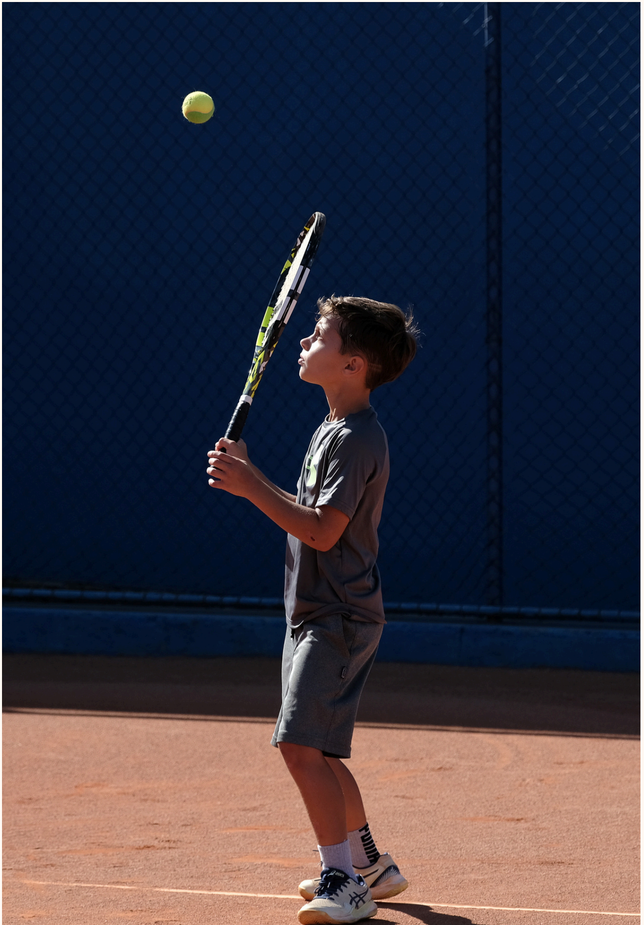
FOTOGRAFIA EM AÇÃO